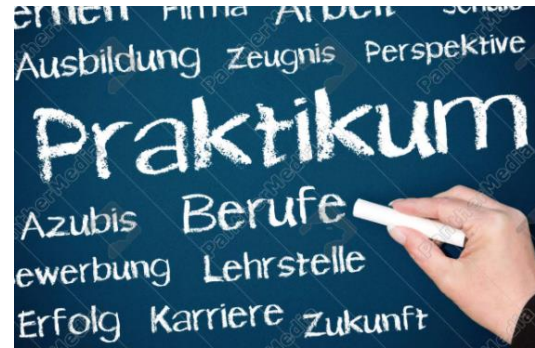
Praktika für die Achtklässler