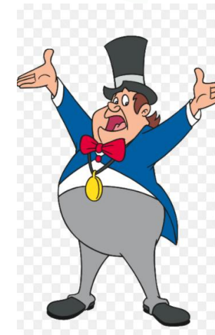
Wer ist Troisdorfs Bürgermeister?