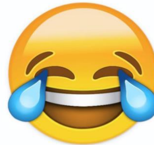
Witze und mehr...