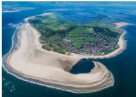
Die Insel Borkum: Ein Traum!